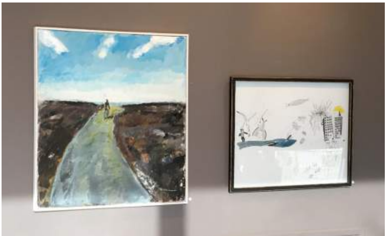
Figurer i landskap